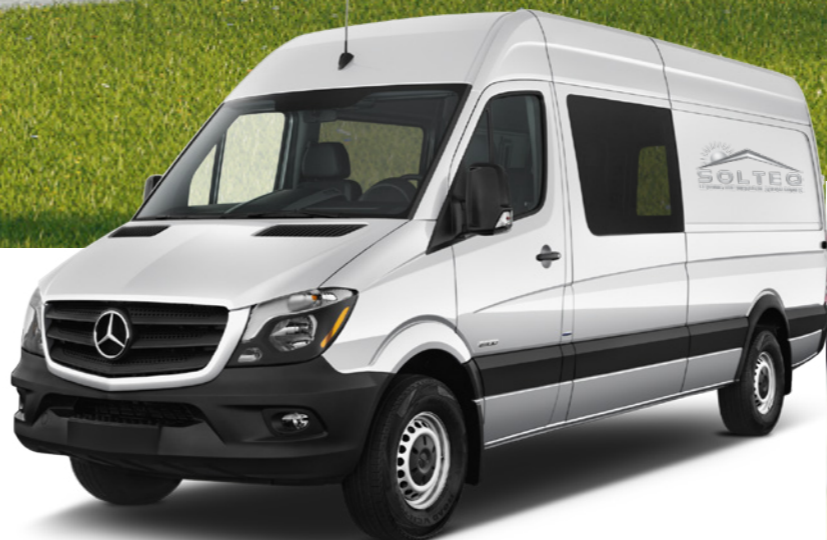
Einsatz-Sprinter für Ihr Montage-Team