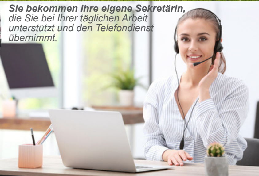
Sie bekommen Ihre eigene Sekretärin, die Sie bei Ihrer täglichen Arbeit unterstützt und den Telefondienst übernimmt.